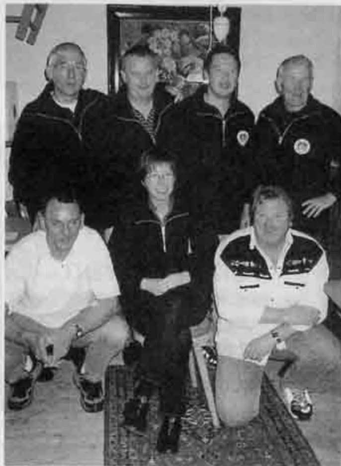
Das Bild zeigt unsere neuen schwarzen Ritter und ihre beiden Peiniger.