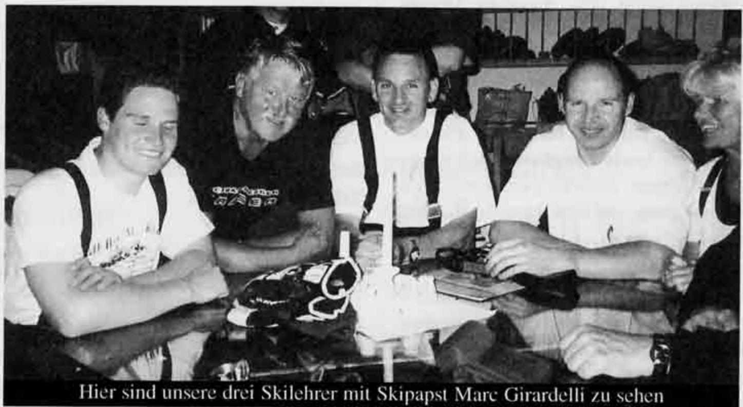
Hier sind unsere drei Skilehrer mit Skipapst Marc Girardelli zu sehen

die in Gruppen (mindestens 9 Teilnehmer) kommen, gibt es Vorzugspreise. In diesem Fall kosten Tagespässe für Erwachsene 29,- DM, für Schüler 24,- DM und für Kinder 19,- DM. Dieses Entgegenkommen ist im Wesentlichen auf