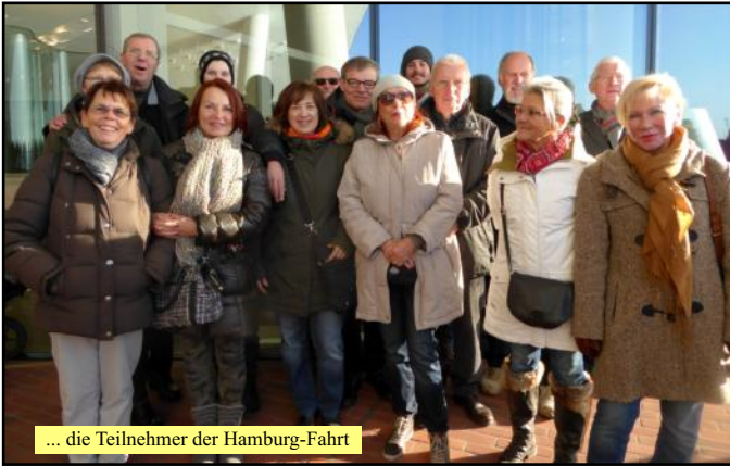
... die Teilnehmer der Hamburg-Fahrt

zugänglich. Da die Kapazität begrenzt ist, wird der Besuch über die Ausgabe von Plaza-Tickets geregelt. Auf 37 Metern Höhe bietet die öffentliche Aussichtsplattform einen Rundblick auf die Stadt und den Hafen. Einfach nur den Blick schweifen lassen, sich satt sehen, den Möwen zuhören und den Schiffsirenen, den Blick auf die Speicherstadt, den Michel und die anderen Kirchen und die Gebäude der Hansestadt.