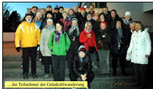
... die Teilnehmer der Grünkohlwanderung

einem leckeren Grünkohlbuffet (Grünkohl, Mettwurst, Kassler, Schweinebauchfleisch und Kartoffeln) und natürlich mit Kaltgetränken versorgt. Da kann man sich gut vorstellen, dass es wieder mal ein wunderbarer Samstagabend wurde!